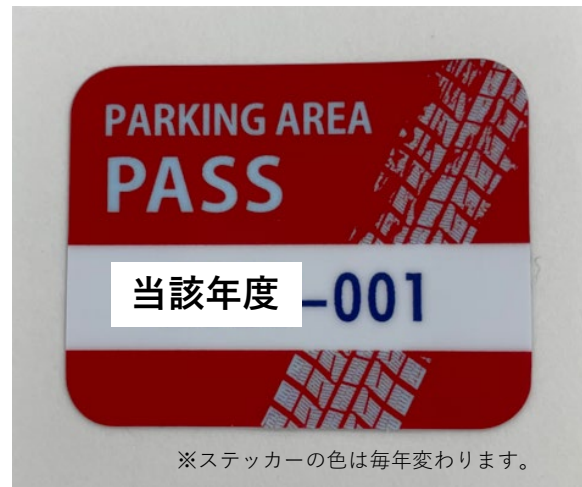
駐輪場許可証(ステッカー)